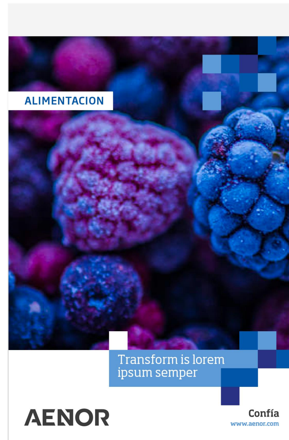
Titular en caja