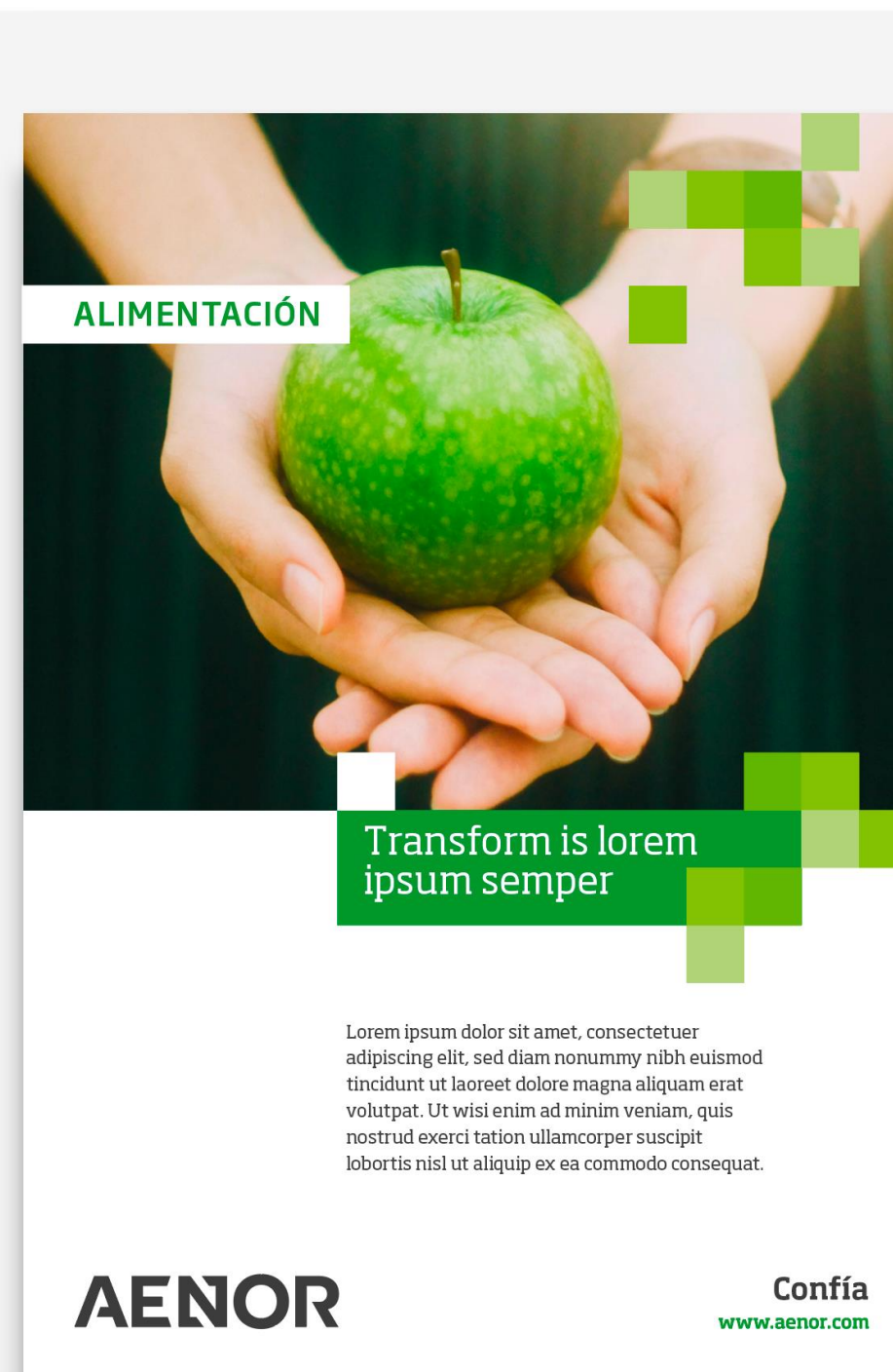
Titular en caja + cuerpo de texto